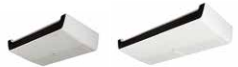
V-W0720M2S / V-W0830M2S