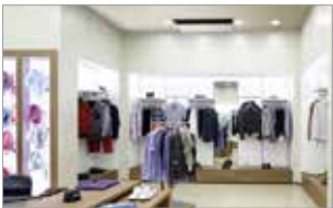
▶ 중/소형 상업시설