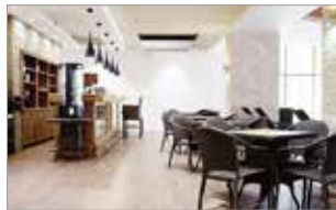
▶ 식당 및 카페