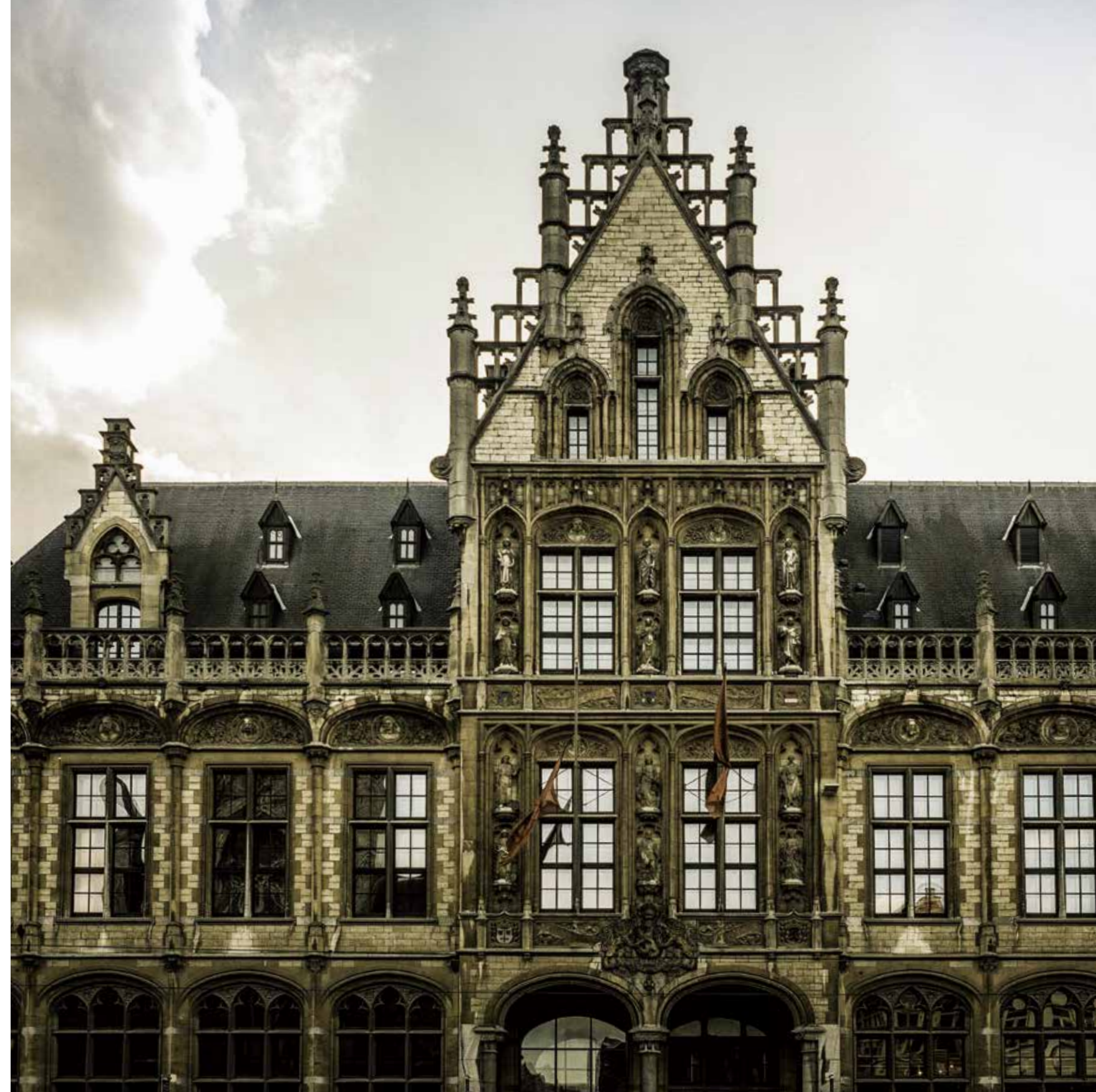
1898 The Post – This small designer hotel opened in 2017 in the upper floors of Ghent’s old post office building. Located in the very heart of Ghent, the hotel offers its guests some of the best views in the city.

‘멋있게’ ‘건강하게’ ‘즐겁게’ 살기 위해 필요한 것은 바로 여유와 여가다. 가족 구성원들과 보다 나은 여가를 통해 고급스러운 레지던스에서 보내는 여유로운 시간은 당신에게 행복함과 즐거움을 선사할 것이다. 풍요로운 삶을 꿈꾸는 당신을 위해 세계 각국의 럭셔리 레지던스를 소개한다. 성은주 기자