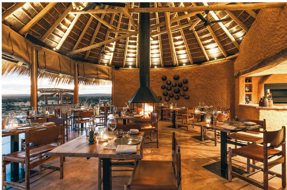
Het recept van Arnaud Zannier: eerlijke gerechten en een architectuur die versmelt met de omgeving.

E r ligt nog een laagje ijzel over de bush wanneer we, gezeten in een open terreinwagen, de zon langzaam zien opkomen over de savanne. Gewapend met muts, jas en een fleecedekentje houden we halt nabij een open stukje savanne. Het is winter in Namibië, maar ondanks de bitterkoude nachten stijgt de temperatuur er overdag vlotjes tot 25°C. We zijn voor dag en dauw uit de veren om stokstaartjes te spotten. Deze grappige beestjes brengen 's morgens een groet aan de zon. We wachten geduldig ruim een half uur, maar behalve wat opvliegende vogels zien we helemaal niets. De stokstaartjes hebben bij dit koude weer besloten om uit te slapen. Wij zetten onze tocht verder en worden uiteindelijk toch beloond voor het vroege opstaan: we spotten een cheeta, een grootoorvos, Kaapse hartenbeesten, wilde honden en een vrolijke familie bavianen.