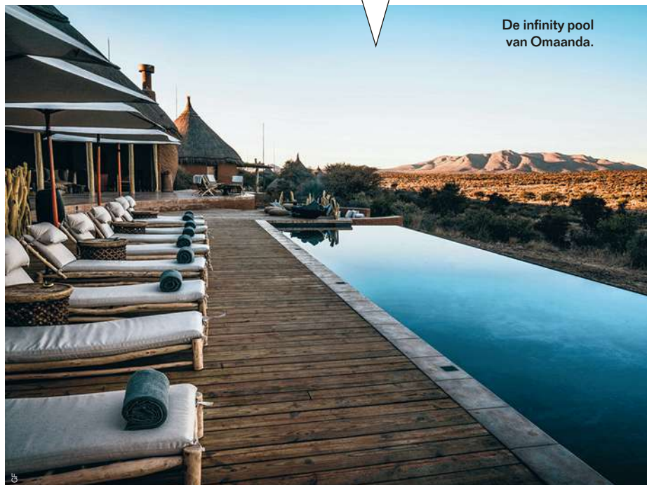
De infinity pool van Omaanda.