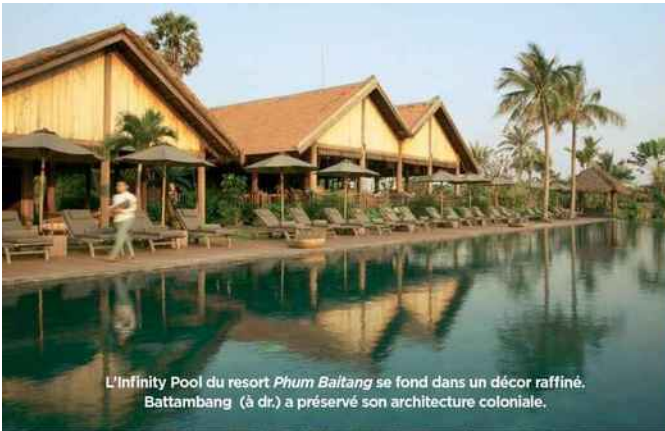
L'Infinity Pool du resort Phum Baitang se fond dans un décor raffiné. Battambang (à dr.) a préservé son architecture coloniale.