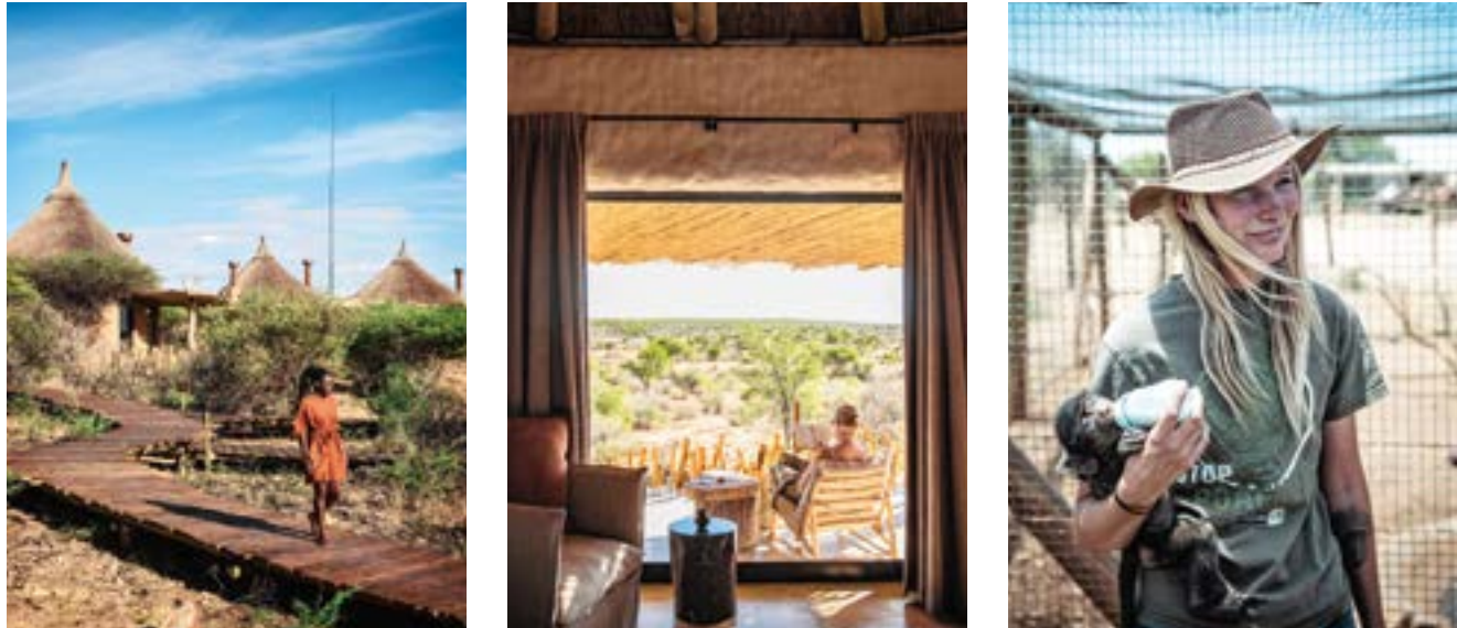
Van links naar rechts: 1. De gebouwen van Omaanda gaan perfect op in de omgeving. 2. Zicht vanuit de slaapkamer van een van de suites. 3. Een van de vrijwilligers bij het dierenopvangcentrum N/a'an ku sê.

Maar hoe dat juist verlopen is, vertel ik morgen wel. Nu is het tijd om van jullie kamers en het hotel te genieten.”