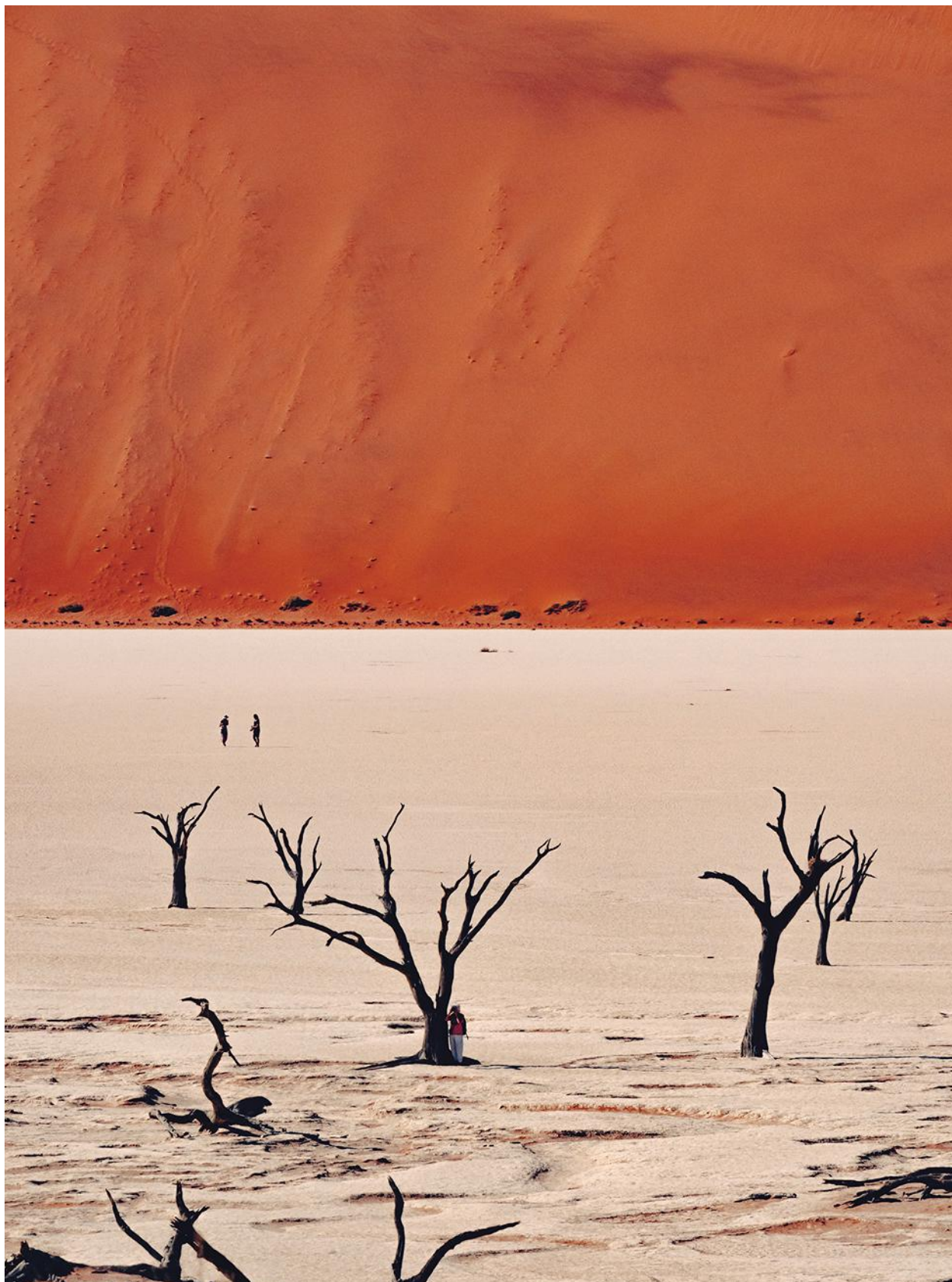
Page de gauche : au cœur d'une réserve de 9 000 hectares, l'hôtel Omaanda compte une dizaine de huttes inspirées de l'architecture du peuple ovambo. Ci-dessus : dans le désert du Namib, Dead Vlei, une cuvette d'argile émaillée d'acacias multiséculaires momifiés, et, en arrière-plan, les spectaculaires dunes rouges.