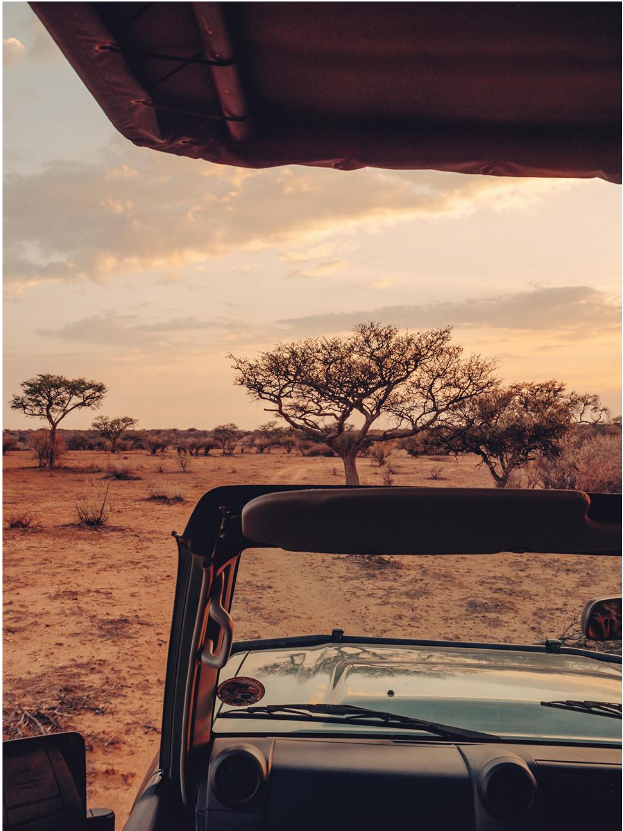
Ci-dessus, virée en 4 x 4 dans la réserve. Ici, aucune noria de touristes armés de téléobjectifs. Page de droite : un éléphant convergeant vers un point d'eau.