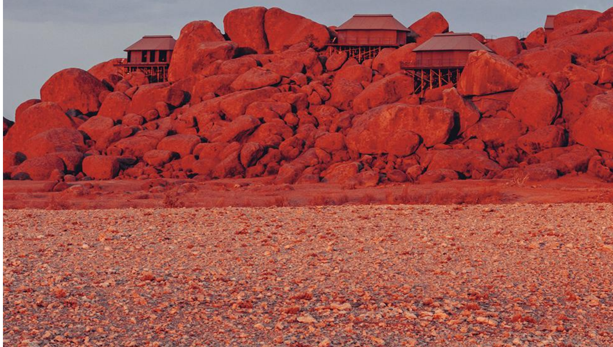
A gauche, la savane à l'heure de la lumière rasante de la fin d'après-midi. Ci-dessus, l'hôtel Sonop, 10 lodges sur pilotis juchés sur d'immenses rochers granitiques.