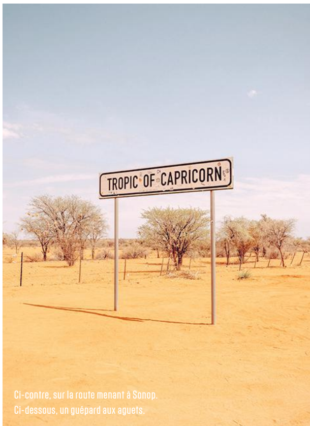
Ci-contre, sur la route menant à Sonop. Ci-dessous, un guépard aux aguets.